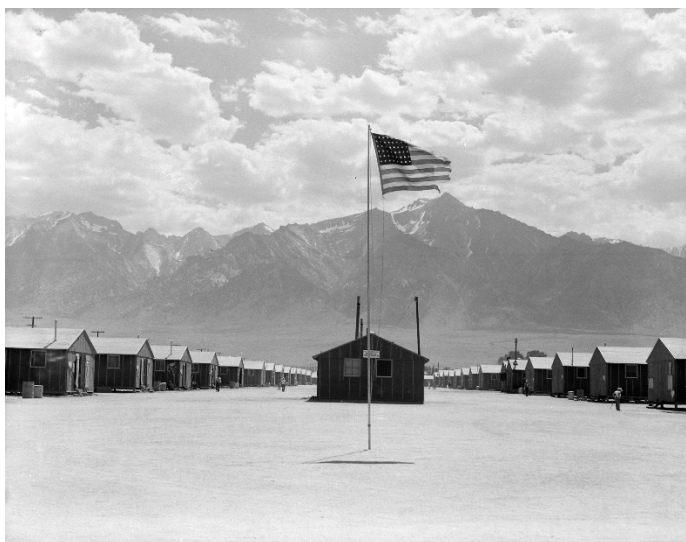
1942 年のマンザナー収容所

背後に険しい山脈のそびえる荒野の中の収容所跡には、当時の暮らしを伝える展示施設や、人々が暮らしたバラックや共用シャワー、食堂などが再現されています。この JBA によるバスツアーでは、往路は関連したドキュメンタリーなどをご覧いただきながら、マンザナーへ向かいます。現地では巡礼プログラムの一部を見学した後、各自で収容所跡および資料館を散策していただく予定です。