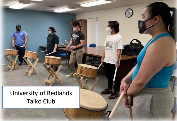
University of Redlands Taiko Club