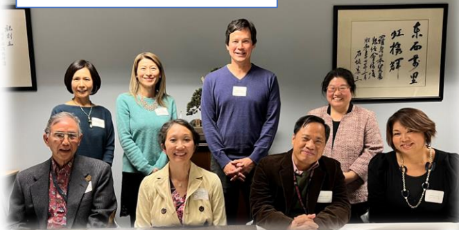
2022 JEG Award Ceremony