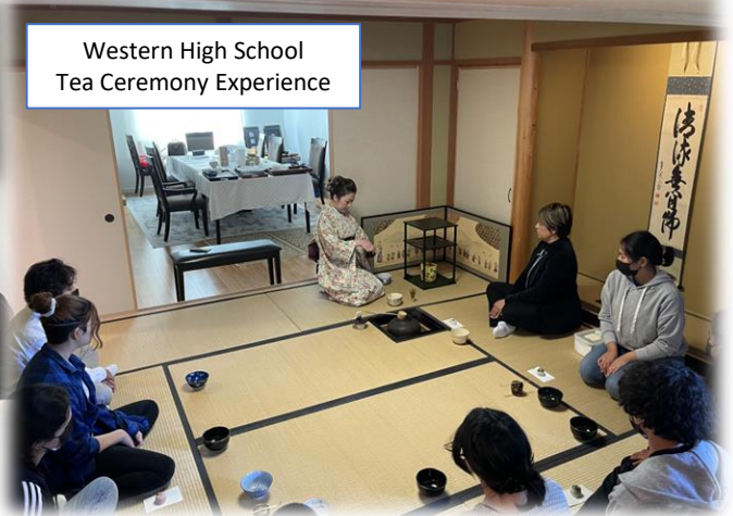
Western High School Tea Ceremony Experience