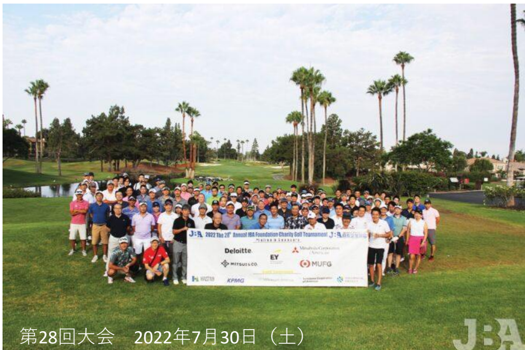
第28回大会 2022年7月30日（土）